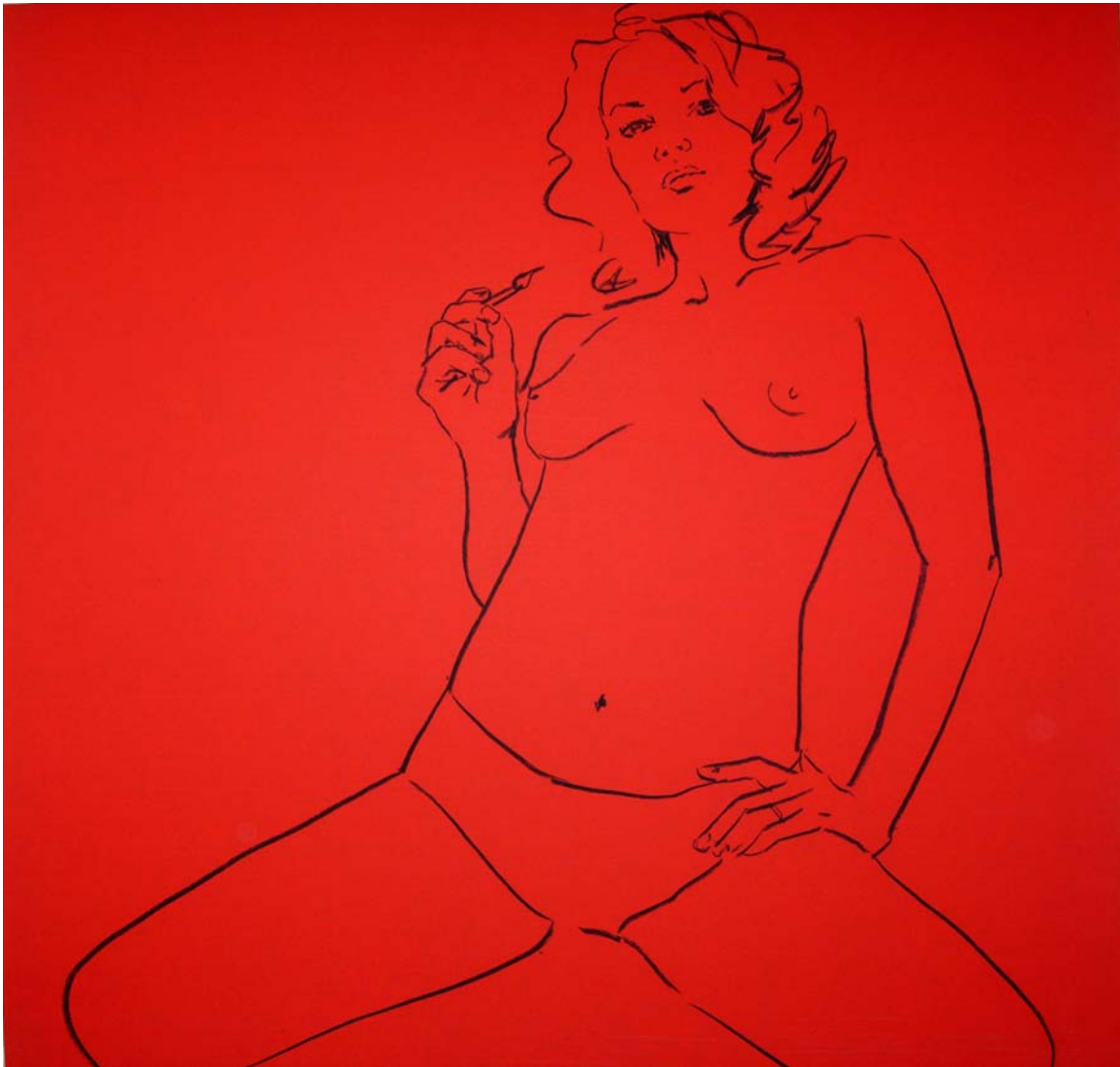
Portrait of the Artist as an Artist (Part 1) acrylic on board 90 x 90 cm (2007)