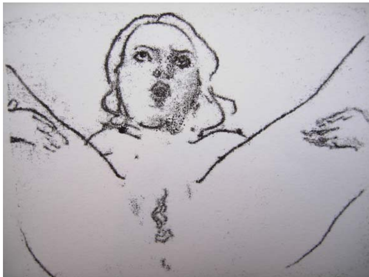
Legs Spread 'O' monoprint 21 x 30 cm (2006)