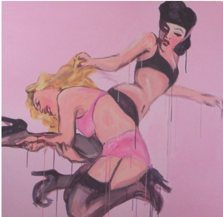
I Could Gobble You All Up (pt 1) acrylic on board 100 x 100 cm (2004)